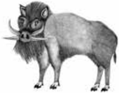
Beast of Dean